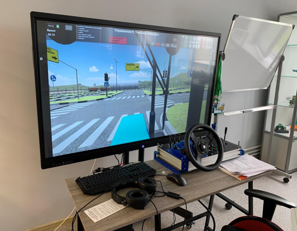
← Тренажёр сельскохозяйственного трактора